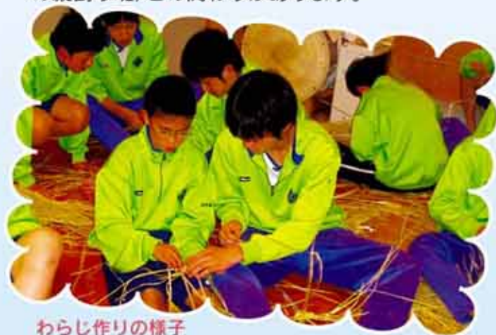
わらじ作りの様子