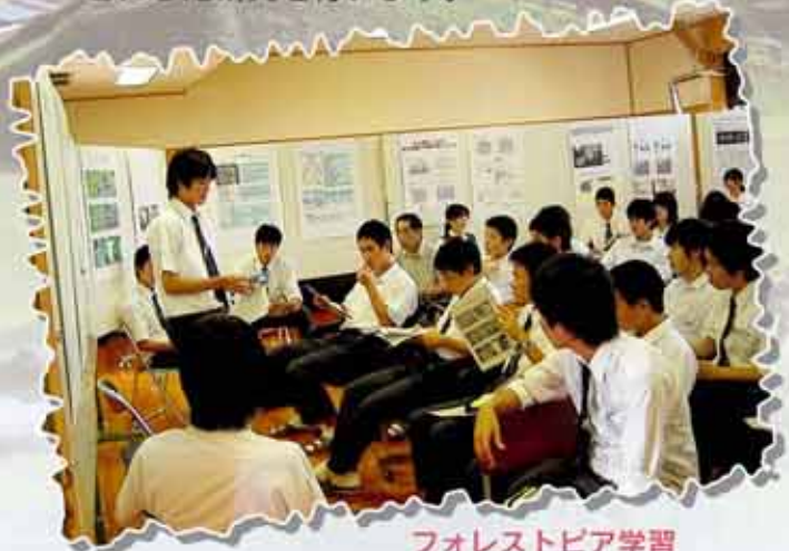
フォレストピア学習