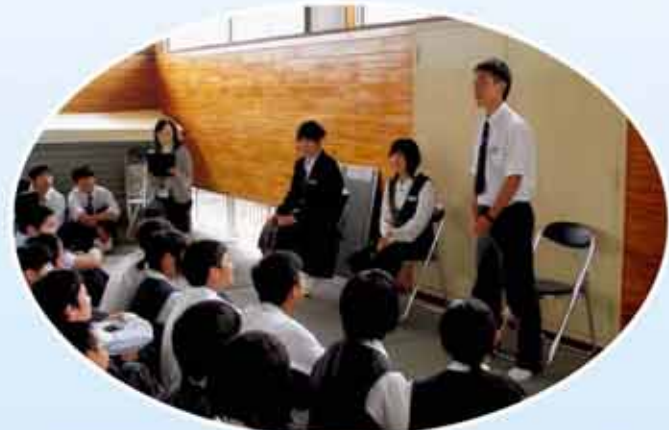
後期生が前期生に「学習の仕方」についてアドバイスしています。