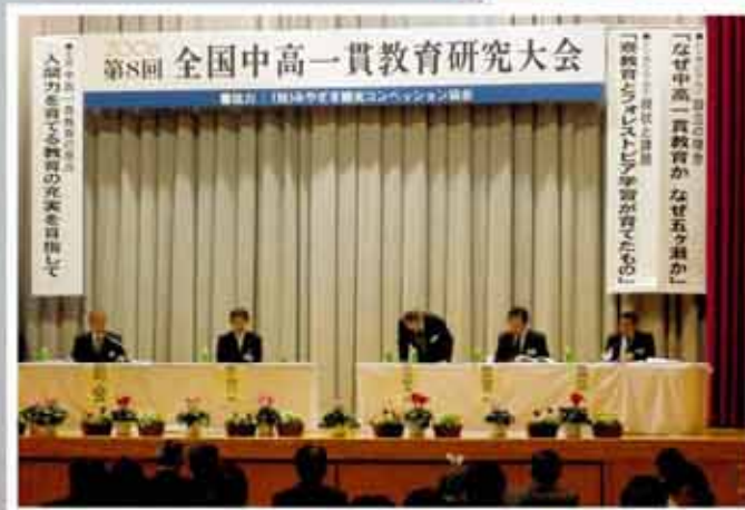
「中高一貫教育の原点」をテーマに、本校で開催された平成20年度 第8回全国中高一貫教育研究大会の様子

恵まれた自然の中で感性を磨き、生徒一人ひとりの個性を開発する教育を通して、眼(まなこ)を世界に開き、未来を切り拓く、創造性豊かで主体的に生きる人間の育成を図る。