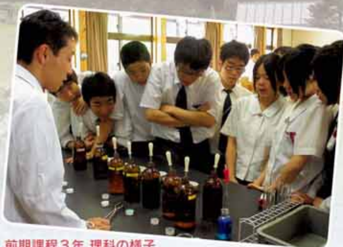
前期課程3年 理科の様子