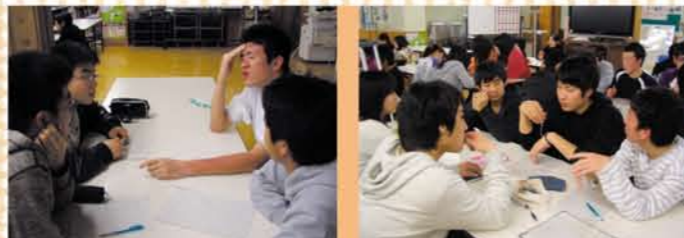
6年生が下級生に、自分の進路決定までの苦労話を話してくれます。