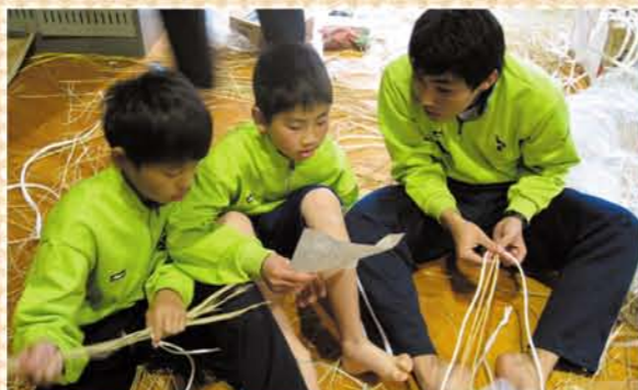
わらじづくりの様子です。6年生が1年生に教えています。

●ファミリー制度も少人数指導のひとつです。1年生から6年生までの1人から2人ずつを1班として、担当の先生がつき、様々な活動を通して家庭的なつきあいをします。ファミリーで昼食会や夕食会、菜園活動などを行っています。