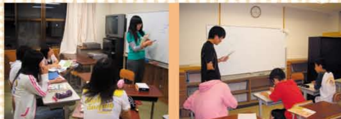
寮での学習の様子です。上級生が下級生に勉強を教えています。

●前期生は後期課程(高校)の先生方からも学ぶことで、早くから、より専門的な内容に触れられ、興味関心がさらに高まります。