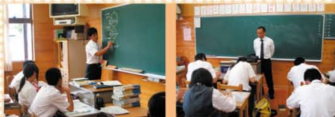
教科によっては、10名前後の少人数で授業を受けることもあります。

●全校生徒240名に対し、教職員43名。各学年1学級なので、手あつい指導を行うことができます。