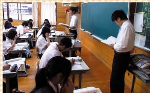
多くの教科でチームティーチング形式の授業が行われています。

●前期生は後期課程(高校)の先生方からも学ぶことで、早くから、より専門的な内容に触れられ、興味関心がさらに高まります。