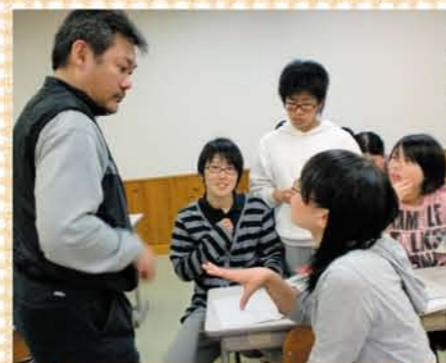
寮で、ハウスマスターの先生が生徒に対応しています。