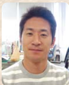
宮崎県立看護大学 助教