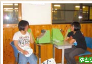
ゆとり・回らんの時間