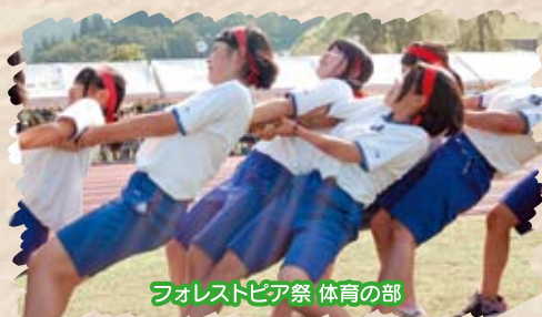
フォレストピア祭 体育の部