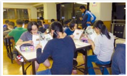
ハウスマスターの先生の寮教育

全校生徒230名に対し、教職員41名で指導に当たるため、手厚い指導を行うことができます。朝や昼休み、放課後の時間だけでなく、夜の寮での時間など、先生方が、生徒の勉強の質問や様々な相談に対し、きめ細かに指導に当たります。フォレストピア学習の研究論文には、生徒1人1人に担当の先生方がそれぞれ1人ずつつき、指導を行います。後期生になると、20人学級となり、さらにきめ細かな少人数指導を受けることができます。