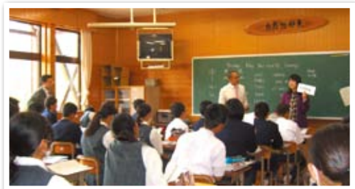
2年生の英語の一貫指導

また、後期の先生が前期生を教えたり、前期の先生が後期生を教えたりする中で、他の中学校では真似できないような、効率的・一貫的な教育を行うことができます。