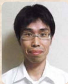
宮崎県精神保健福祉 センター勤務

その根本には、学びの森で私に様々なことを教えて下さった先生方や寮母さん方からの支援があると思っています。