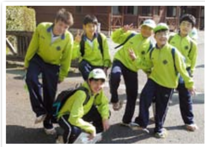
ファミリーでわらじ遠足

1年生から6年生までの1人から2人ずつ(計7～8名)を1班として、担当の先生がそれぞれの班に1人つき、様々な活動を行います。ファミリーでの昼食会や夕食会、菜園活動を通して家庭的なつきあいをすることができます。また、学年を超えての触れ合いの中で、コミュニケーション能力などの幅広い社会性を身につけることができます。