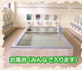
お風呂(みんなで入ります)

休日は他のファミリーとの合同会食もします。計画から食材の購入、調理まですべてファミリーで協力してします