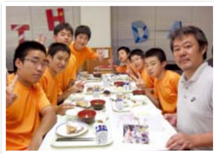
ファミリーとの交流会