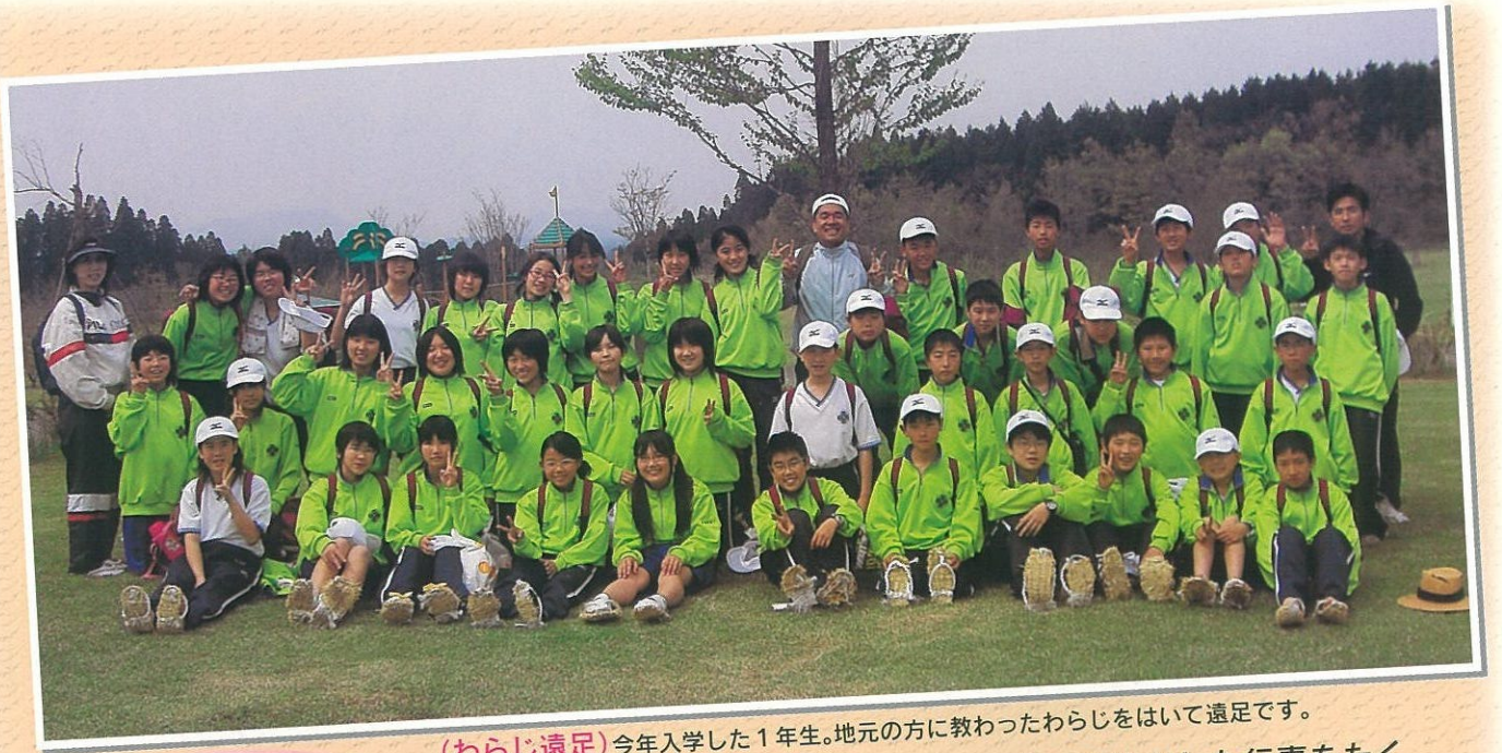
(わらし遠足) 今年入学した1年生。地元の方に教わったわらしをはいて遠足です。