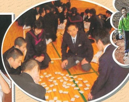
(百人一首大会) 前期生で百首暗記を目指しています。