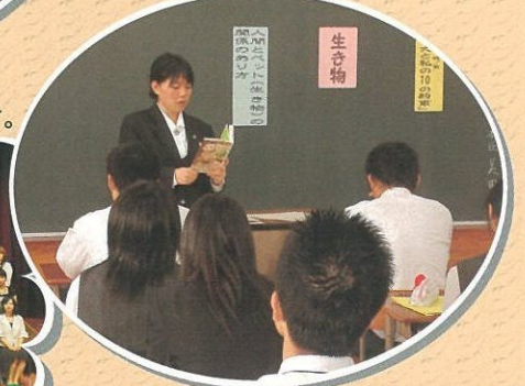
(ブックトーク) 毎朝の読書の時間はもちろん、本について語り合うことも大切にしています。

他にもフォレストピア祭(体育祭と文化祭の総称)や修学旅行(3年、5年)等が行われます。