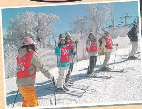
(スキー教室) 南国宮崎でもスキーが上達します。

本校では、五ヶ瀬の自然や人とのふれ合いを生かした行事をたくさん行っています。きっと今までにない感動を味わえるでしょう。