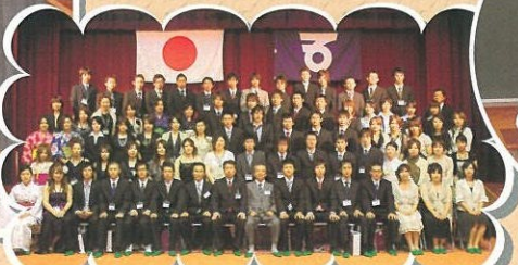
(成人式) 五ヶ瀬町の成人式に参加させてもらっています。