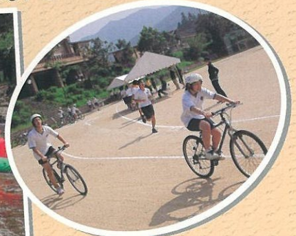
(ミニトライアスロン) 水泳、自転車、マラソン。 苦しいけど全員でゴール!!