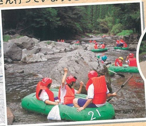
(急流下り) 地元の中학생との交流もあります。