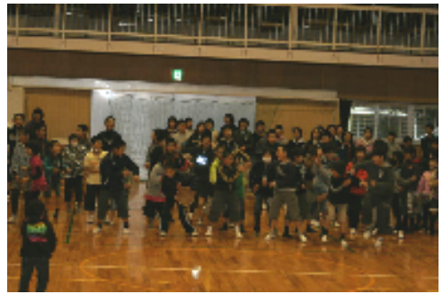
【アンコールのダンス】

3月9日(金)はお別れ遠足でしたが、あいにくの雨模様で、校内遠足となりました。晴天の中、花の香りを楽しみながら歩くのを楽しみにしていたのですが、天気にはかないませんでした。残念でした。