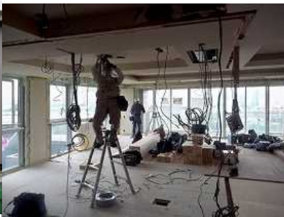
マンションの電気配線工事