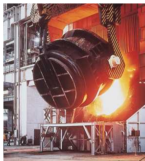
製鉄会社・転炉（鉄の精製）