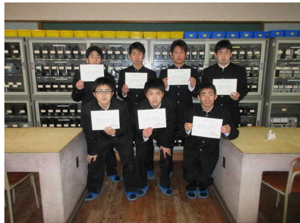
2級電気工事施工管理技術検定 6名合格（3年生希望者）