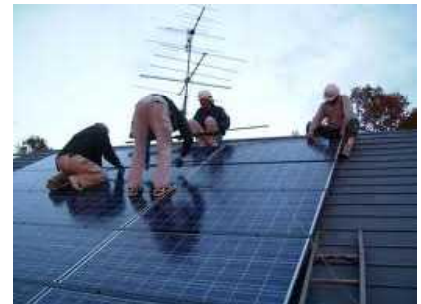
太陽光パネルの設置工事