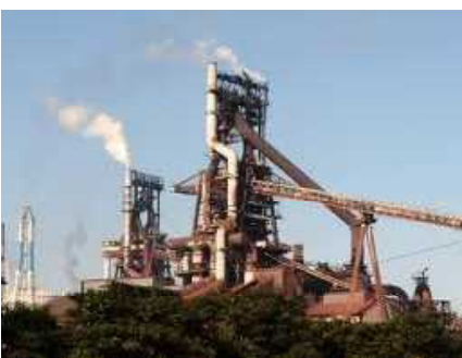
製鉄会社・高炉（鉄を生み出す）