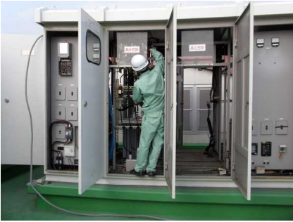
高圧受電設備の工事