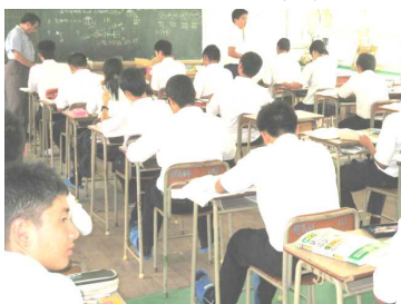
自己採点のようす