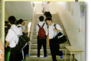
今日も 1日おりました