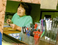
購買部の利用 まっています