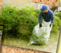
いつもごころう様です