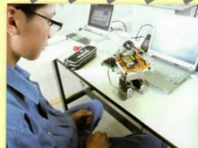
うまく重かいてるかな...