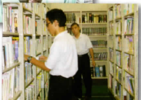
昼休みは読書ですね