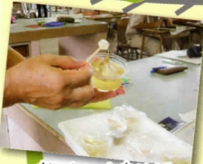
おいしい水あめが できました