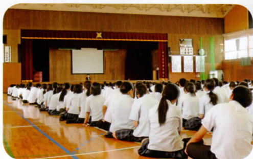
保体授業による1年生への指導の様子