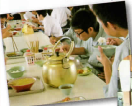
おいしい 食事をありがとう