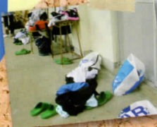
もう少し?! がんばりましょう。