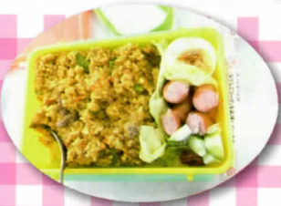
お弁当 ありがとう