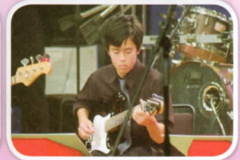
第13回 九州スチューデントジャズフェスティバル 最優秀賞 グッドスイング賞