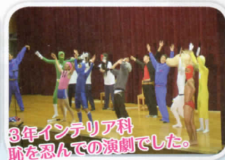
3年インテリア科 恥を忍んでの演劇でした。