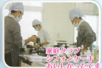
家庭クラブ シフォンケーキ おいしかったです。