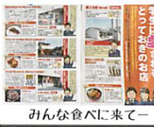
みんな食べに来てー

都工会館研修所 この研修所は 昭和59年 創立40周年記念事業の一環として 同窓会の中心となりPTA 職員 其他有志のご協力を得て建設されたものです。 感謝の気持ちで大車に使いましう。 皆様ご存知でしたか