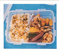
たまには 自分で作ってる?