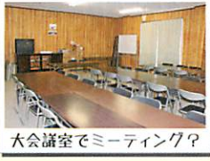
大会議室でミーティング?

※都工会館は、食堂と宿泊施設の売上げのみで運営されています。近年利用者が減っている為、運営がきびしくなっています。 ※仕入れは会館職員(計5名)で、すべて行っています。御家庭で使い切れない野菜一本等でも、寄付は喜んで受け付けています。 ※持ち出しできる弁当は、容器代として百円預かってます(返却時に返す)。タッパーは必ず返却して下さい。(ゴミ箱にすててあった事も...) ※今でも卒業生が食べにきます。一般利用もOKなので、父兄の方々も、是非ご利用下さい。