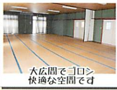
大広間でコロナ 快適な空間です