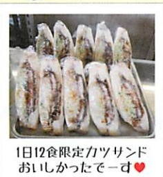
1日12食限定カツサンド おいしかったで一す♥