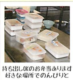
持ち出しOKのお弁当あります 好きな場所でのんびりと