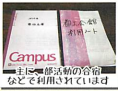
主に部活動の合宿などで利用されています

1日2食 都工生 2400- 他校生 2700- 都工生 1800- 他校生 2100- とてもリーズナブルです 他生徒の利用もOKです