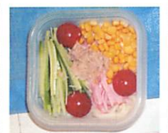
夏はやっぱり冷めん!