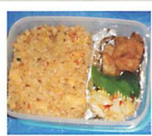
たまには チャーハンもいいですね