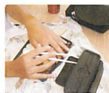
わぁ~おいしそう 見せて~ ダメッ