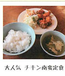
大人気 チキン南蛮定食