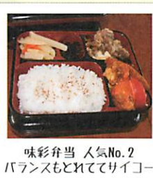
味彩弁当 人気No.2 バランスもとれてサイコー