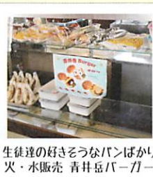
生徒達の好きそうなパンばかり 火・水販売 青井岳パーカー