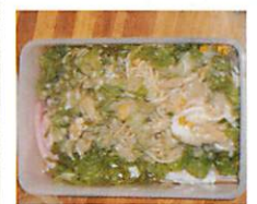
サラダスバゲティー おしゃれ~でもデカイ