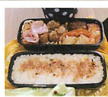
おかずたっぷり ごはんぎっしり