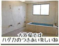
大浴場です ハダカのつきあい楽しいね