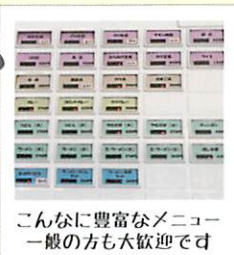
こんなに豊富なメニュー 一般の方も大歓迎です