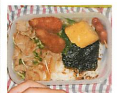
No.1唐揚げ No.2玉子焼 No.3お肉 好きなものばかり...うれしい!