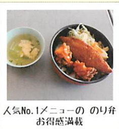
人気No.1メニューの のり弁 お得感満載