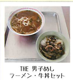
THE 男子めし ラーメン・牛丼セット