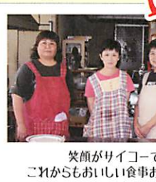
笑顔がライコーです これからもおいしい食事をお願いします