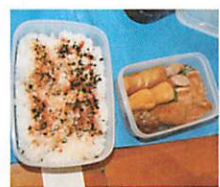
部活動生徒のお弁当 デカイ デカイ デカイ