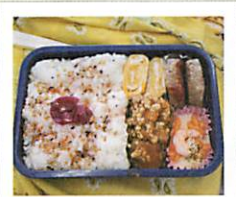
お母さんいつもありがとう 感謝してます

都工生のお弁当 + 人気ベスト3~おかし~ 1. 唐揚げ 2. 玉子焼 3. お肉