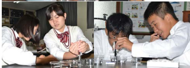
■下：生徒による「水」の実験