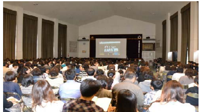
<会場は多くの児童・保護者で大盛況でした！>