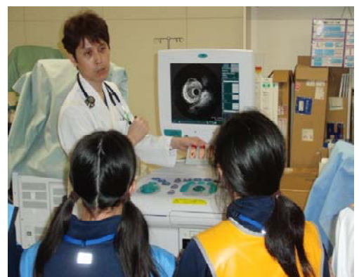
<心肺血管治療実技体験>