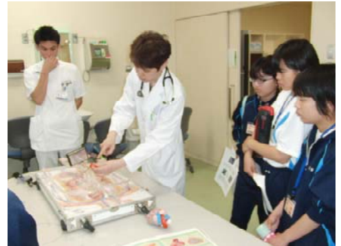
<心肺血管治療実技体験>