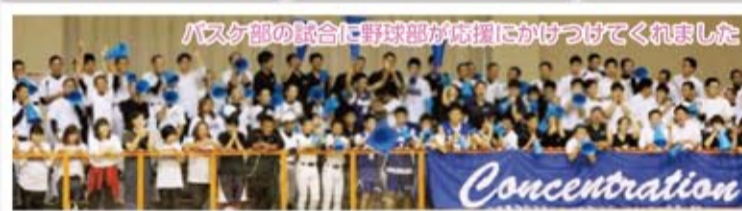
バスケ部の試合に野球部が応援に駆けつけてくれました